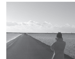
Rückkehr & Zukunft

Notwendigkeit, Karriereschritt oder lang gehegter Traum – wer ins Ausland geht, muss Entscheidungen treffen, die das Leben verändern.