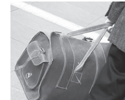
Planung & Aufbruch