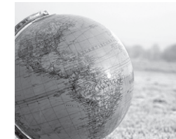
Arbeit & Integration